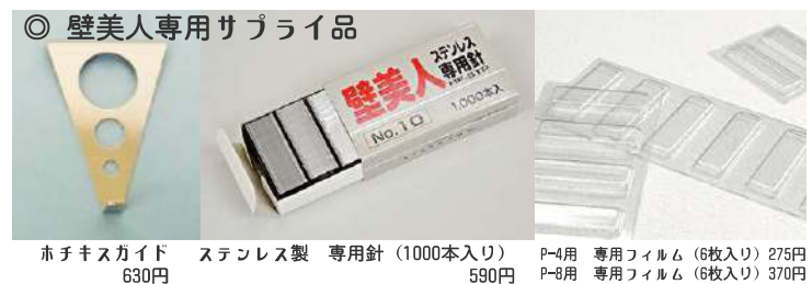
◎ 壁美人専用サプライ品 ホチキスガイド 630円 ステンレス製 専用針 (1000本入り) 590円 P-4用 専用フィルム (6枚入り) 275円 P-8用 専用フィルム (6枚入り) 370円